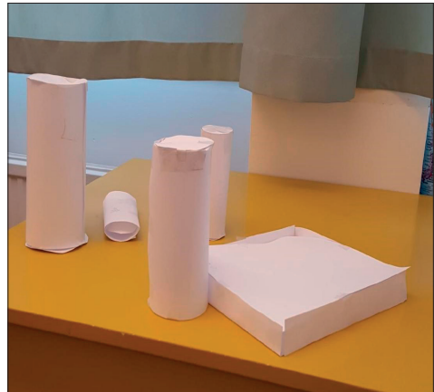
Elever arbetar med begreppet dimension.