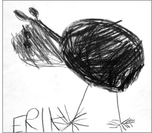
Hvor mange ben har egentlig en flodhest?

Helt til slutt tar vi boken frem igjen. Nå ser vi på illustrasjonene vi har hoppet over,