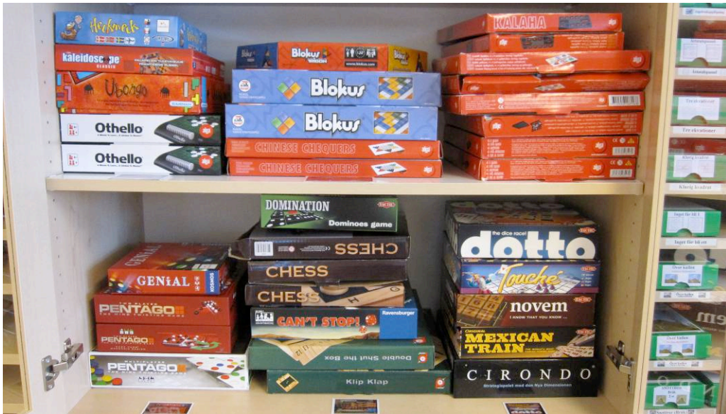
Hyllorna med sällskapspel som kräver mycket logiskt tänkande är populära bland eleverna och mycket flitigt använda.