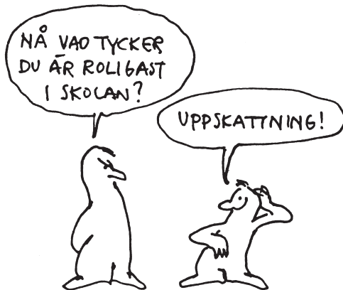
Illustration Eric Werner

I detta läge är det spännande för mig att se huruvida barnen använder mängden i den första burken som referensram. Alla barns uppskattningar antecknas efter barnens initialer på tavlan. När barnen sagt sitt förslag får de leta upp och markera talet på vår tallinje. När alla förslag är uppskrivna tittar vi på talen: